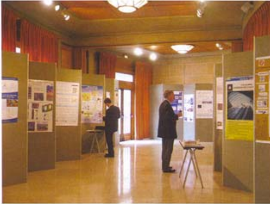
Avrupa Yapı Teknolojileri Platformu toplantılarından, Versay/Fransa.

Avrupa Komisyonu'nun Bilim ve Araştırma'dan sorumlu Komiseri Janez Potocnik'in Türkiye ziyareti kapsamında, 7 Eylül 2006 tarihinde Ankara'da TÜBİTAK ve TOBB ev sahipliğinde TÜBİTAK Feza Gürsey Konferans Salonunda Avrupa Teknoloji Platformlarına ilişkin bir konferans düzenlendi. Konferansta, "Gıda Teknolojileri", "Geleceğin Üretim Teknolojileri", "Tekstil ve Giyim Teknolojileri", "Hidrojen ve Yakıt Teknolojileri", "Hareketli ve Kablosuz İletişim Teknolojileri" konusunda oluşturulmuş platformların yanı sıra, " Yapı Teknoloji Platformu " konusunda da sunuşlar yapıldı. Sunuşu gerçekleştirilen bu platformların yanı sıra, "Nanoelektronik", "Tıbbi Uygulamalarda Nanoteknolojiler", "Su Sağlama Sistemleri ve Tesizat", "Sürdürülebilir Kimya", "Fotovoltaikler" "Küresel Hayvan Sağlığı", "Ulaşım ve Taşıma", "Raylı Taşımacılık", "Ormana Dayalı Sektörler", "Endüstriyel Güvenlik" ve "Yenilikçi İlaçlar" gibi birçok farklı platform olduğunu da biliyoruz. Yapılan toplantı, Türkiye'de farklı sektörden katılımcıların konuyu bütünlük içinde algılamasına yardımcı olarak, bu tür