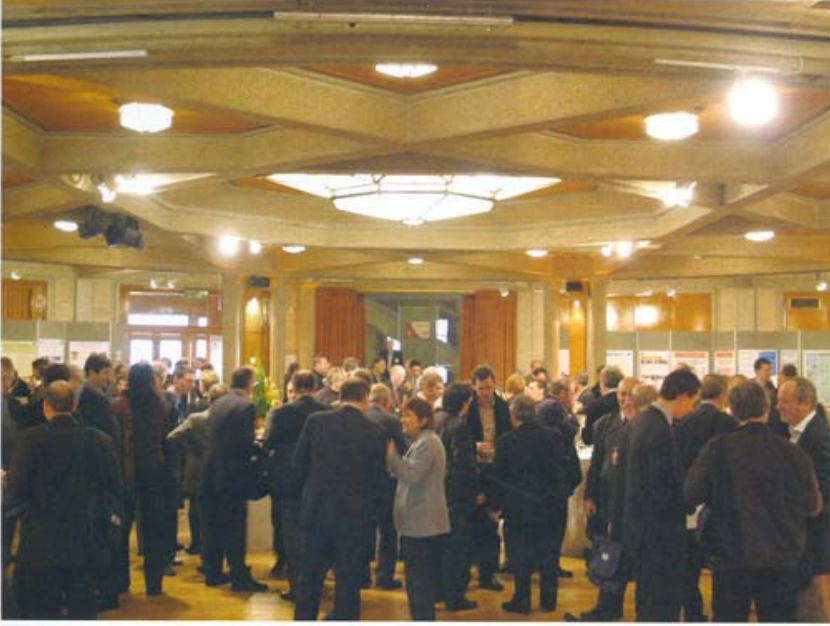
Avrupa Yapı Teknolojileri Platformu toplantılarından katılımcılar, Versay/Fransa.

Yapı Sektöründe Araştırma ve Avrupa Yapı Teknoloji Platformu Konusunda Güncel Gelişmeler